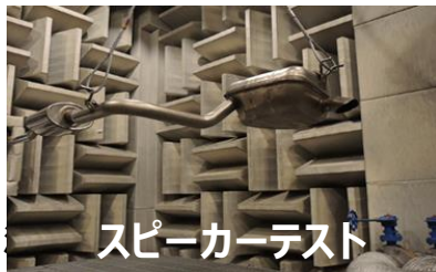
スピーカーテスト